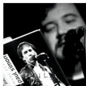
Open Mic uvádí: Sounds of Simon