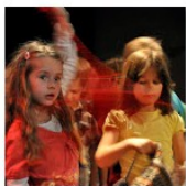
Open Mic POTRVÁ #64 1. 5. 2013