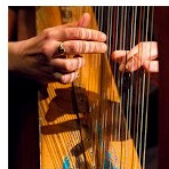
Open Mic POTRVÁ #61 6. 2. 2013