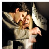
Open Mic POTRVÁ #62 6. 3. 2013